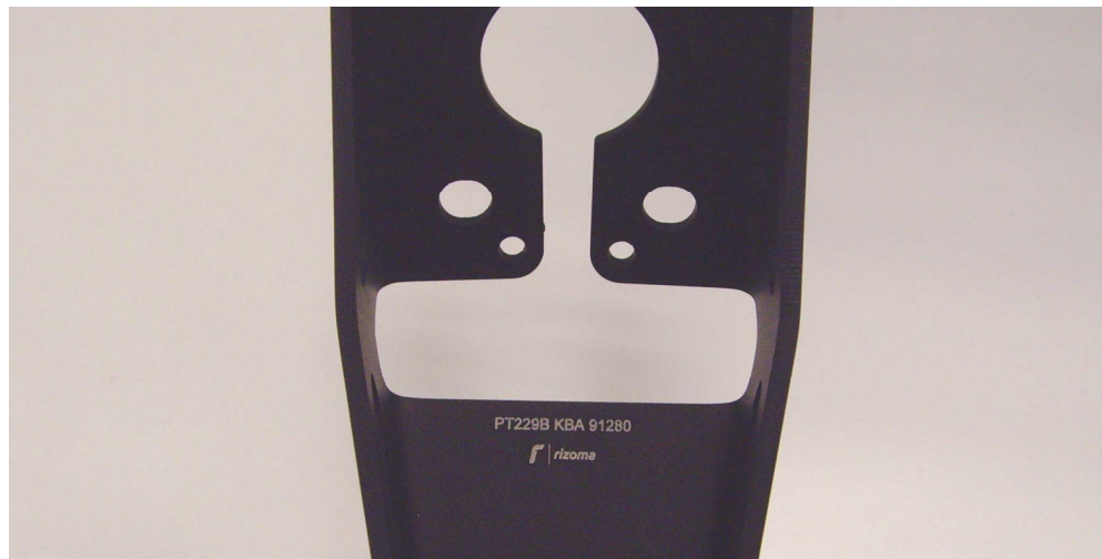
Kennzeichnung, Beispiel Herstellerlogo rizoma, Typ PT, Ausführung 228, Farbcode B (schwarz), Typzeichen KBA 91280