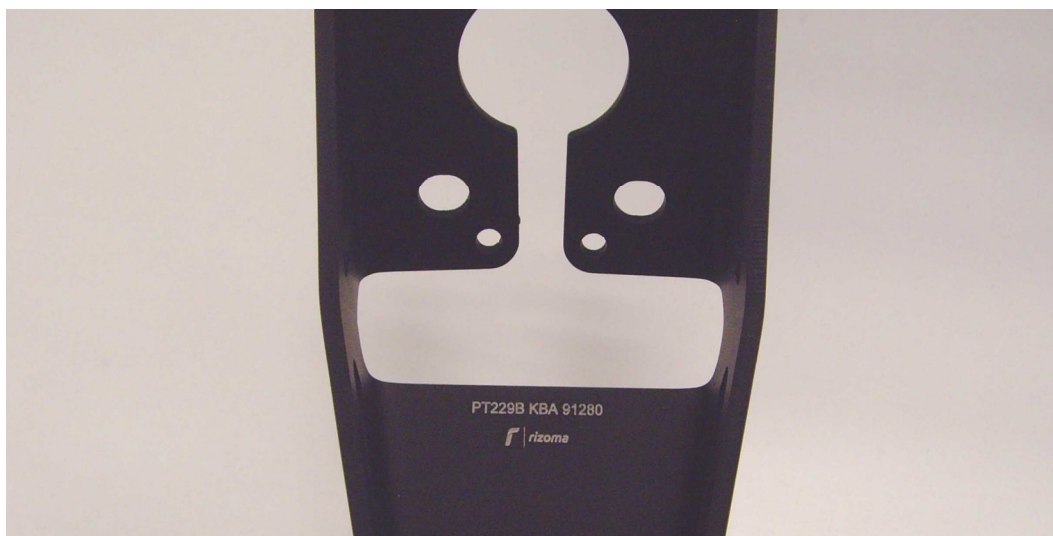
Kennzeichnung, Beispiel Herstellerlogo rizoma, Typ PT, Ausführung 228, Farbcode B (schwarz), Typzeichen KBA 91280